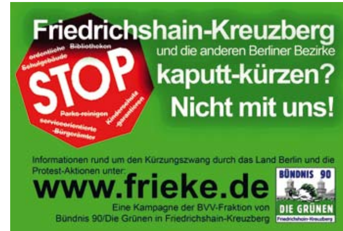
Die grüne Anzeige zur Protest-Kampagne 2007

ben sie fast keine eigenen Einnahmen, wie etwa die Gewerbesteuer. Weil die Bezirkshaushalte seit Jahren drastisch gekürzt werden, haben wir als grüne Fraktion den Streit im Sommer eskalieren lassen und uns gemeinsam mit der Linkspartei geweigert, einen Haushaltsplan zu beschließen. Zusätzlich haben wir mit einer Mail-Kampagne Druck auf den Senat ausgeübt oder für Öffentlichkeit gesorgt, indem wir das