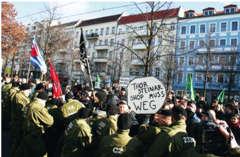
Gemeinsam gegen Nazis: Auch Grüne zeigen Flagge vor Ort